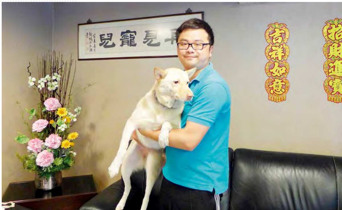
邱生和店裡的寵物大使「嘸妹」溫馨合影