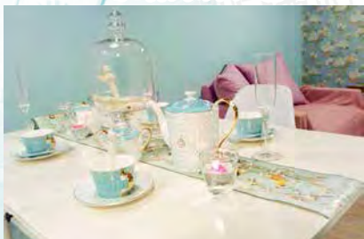
女生主題的partyroom，精緻的餐具常常吸引女性顧客照個不停。

A：雖然如此，現在party room已經出現飽和的情況，據我所知，現在有超過二十間party room分佈在觀塘不同的工廈區域。更甚的是，主題房間為了吸引顧客眼球，均投入巨大裝修費用。然而，因應使用者的消費能力，只能薄利多銷，好像不太划算。