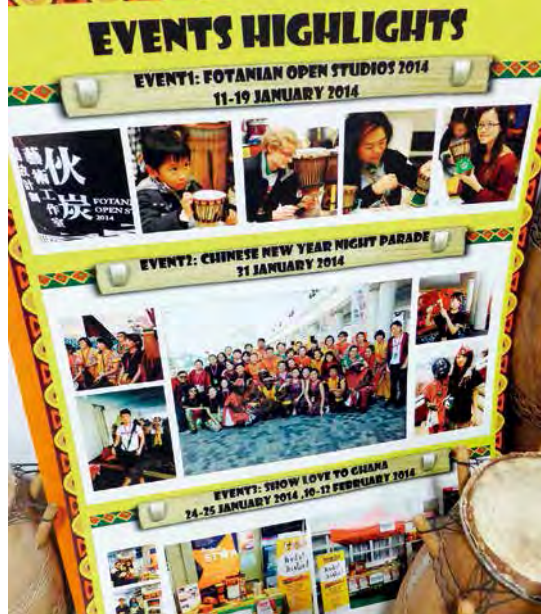
藝術中心年中亦會參加不少慈善和工作坊活動