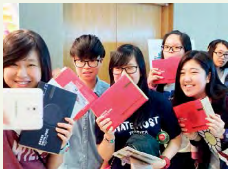
4月25日，參加完問答遊戲的學生正拿著獎品開心自拍。

以下是我們試著用這種方法，通過圖像來還原七天的展覽，給去過的人一份回憶，也給沒去過的人彌補一份遺憾。