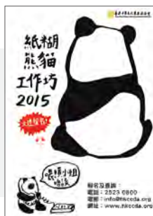
紙糊熊貓工作坊-海報

面向全港學界的紙糊熊貓工作坊，已經有超過30間學校參與，你還在猶豫什麼，快報名參與吧！