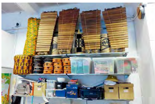
藝術中心陳列的其它非洲樂器