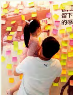
展覽老少咸宜，是親子的好機會