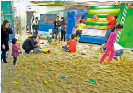
室內沙灘，沒有猛烈陽光和洶湧波濤，適合親子遊玩。

A：我還知道因為工業廠房的建築規格，偌大的空間只有少量的主力樑柱，因此可以取用更自由的室內設計，更容易打造夢想中的完美店鋪。好像不少手作愛好者，就喜歡租廠廈作為工作室與實體店，既有足夠的場地開辦工作坊傳授技能，又可以擁有寬闊的藝術創作空間，一舉兩得。