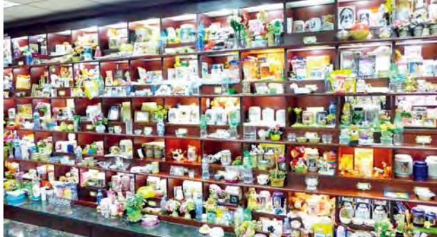
店裡擺放了過百個寵物骨灰龕