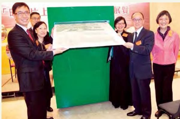
民政事務局長許曉暉副局長和教育局楊潤雄副局長兩位主禮嘉賓在本會負責人陪同下，一起寄出巨型明信片，寓意將喜悅和共賞之情寄送至全港。