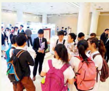
明信片導賞結束後，學生圍著導賞員作交流