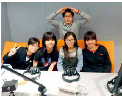
圖為屯門天主教中學學生參與歷史文化學堂錄音留念