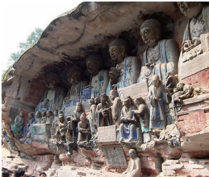
▲寶頂山上的大足石刻

在宗教文化方面，重慶大足石刻更是中國南方石窟藝術頂尖之作的代表。寶頂山上的摩崖造像鑿於南宋年間，周圍遍佈佛像，特別是以聖壽寺為中心的佛像大佛灣、小佛灣造像，以六道輪回、廣大寶樓閣、千手觀音像等最為著名。佛像精雕細琢，唯美唯肖，佈局莊嚴，是佛教傳入中國興盛的象徵。從世俗到宗教，大足石刻除了有濃厚的宗教色彩外，更鮮明地反映民間的日常生活，所表達的故事和哲理更讓人有無盡的遐想，道盡人生滄桑，展現出佛教、道教和儒家思想互相揉合的和諧性。