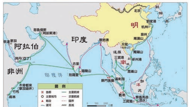
明代鄭和航海路線圖。