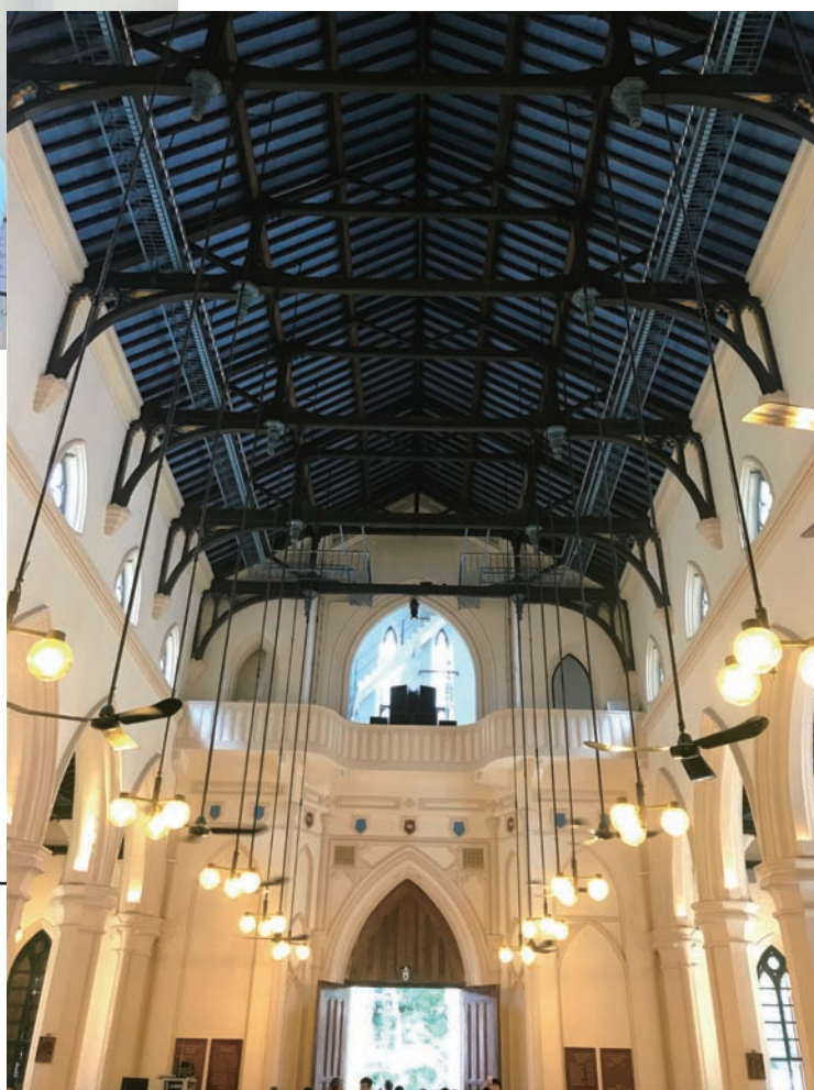
▲ 聖約翰座堂的內部。

聖約翰座堂是牧區教堂和英軍駐防軍的聖堂，並且是本港唯一的以永久業權形式持有的土地（Freehold）。座堂是香港現存歷史最悠久的西式基督教會建築物，於1996年1月5日宣布成為香港法定古蹟，以保育古建築為由，座堂至今仍沒有冷氣供應。香港於第二世界大戰淪陷期間，座堂被迫改作為日本人的會所，直到戰後重開和經歷復修。現時座堂的花園內保留了大戰的紀念碑和英國軍人麥士維的墳墓，這是一位天主教徒葬於基督教聖公會的座堂內，歷史意義深遠。