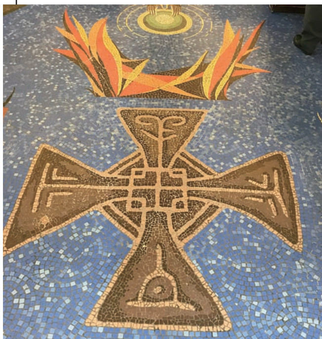
▲ 座堂內別緻的馬賽克圖案。

香港是中西方文化匯聚的城市，擁有中外宗教和諧共融的優勢，就讓我們透過考察歷史古蹟進一步認識各宗教的特徵。📍