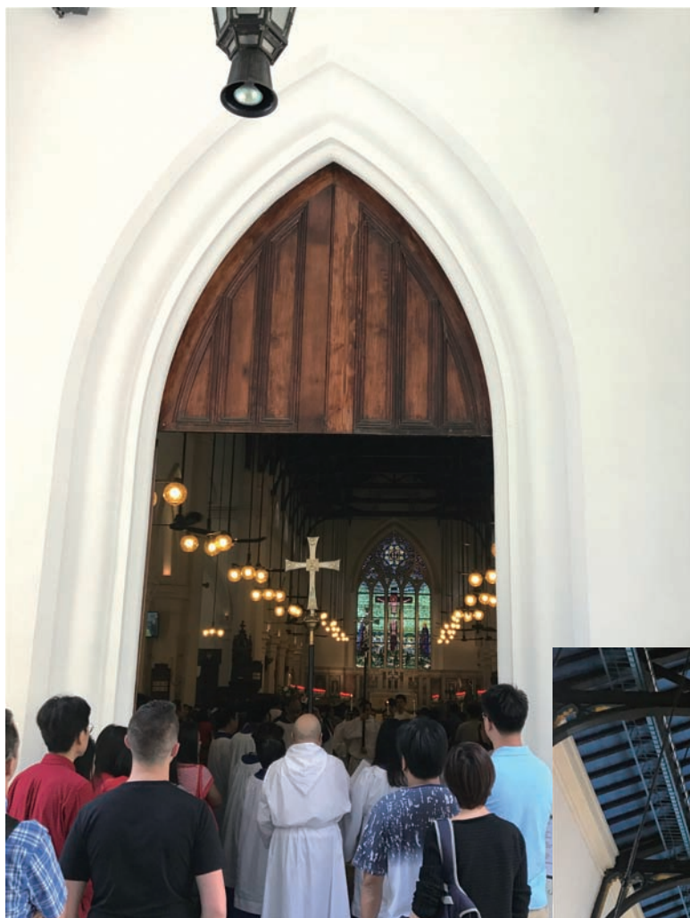
▲ 眾多的基督徒參與崇拜，是一所國際性座堂。

聖約翰座堂的建築設計別具特色，以青磚和石材建成，糅合十三世紀的建築風格，深受英國哥德式風格所影響。