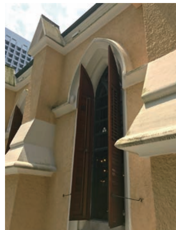
▲ 百葉窗的設計是以適應香港亞熱帶氣候而採用。