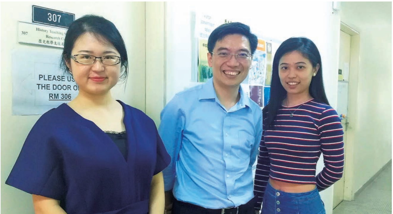
區博士與記者合照。

區博士表示，年輕人要努力發揮超級聯繫人的角色，充分利用香港多年以來和世界其他國家不同法律體系交流合作的經驗。他相信香港的年輕人勢必成為一帶一路的中堅力量，因此更應該主動以法律知識武裝自己，為國家和地區未來的發展儲備力量。➡